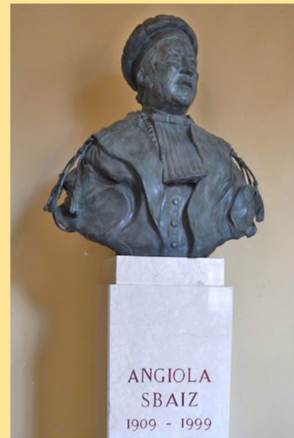
Primo Presidente donna dell'Ordine degli Avvocati di Bologna